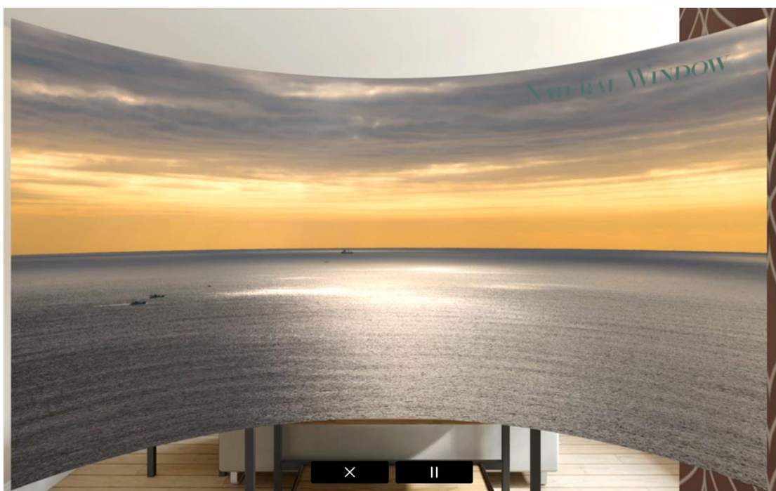
「Natural Window アプリ」利用イメージ