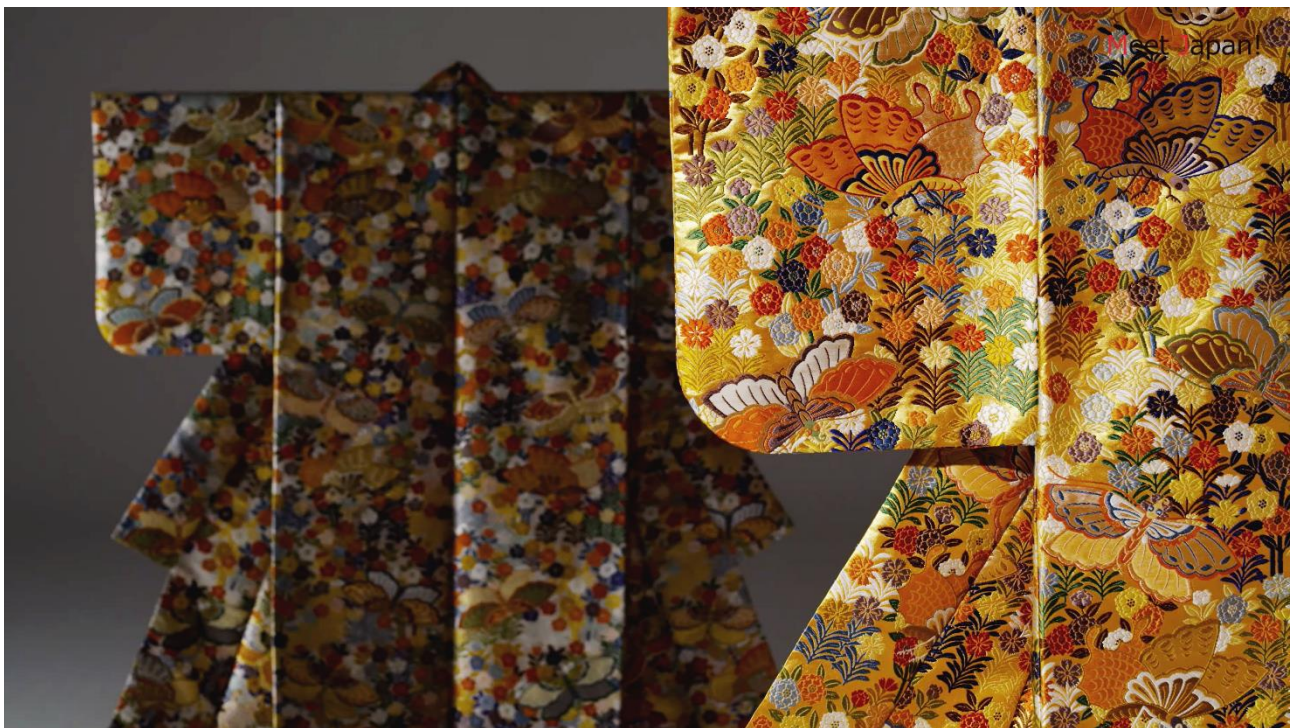
「Meet Japan!アプリ」内のコンテンツシーン「唐織」

TOPPAN ホールディングスのグループ会社である TOPPAN 株式会社(本社:東京都文京区、代表取締役社長:齊藤 昌典、以下 TOPPAN)は、Apple Inc.(本社:米国カリフォルニア州、最高経営責任者:ティム・クック、以下 Apple 社)が 2024 年 2 月 2 日(米国時間)に発売する初の空間コンピュータ「Apple Vision Pro」向けアプリとして、日本の魅力を臨場感溢れるオリジナル高品質映像を体験できる「Meet Japan!アプリ」と、癒しの空間を体感する超臨場感環境コンテンツ「Natural Window アプリ」を、「App Store」上で提供開始します。