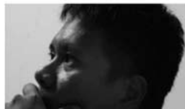
写真家ラドウィン・ヌルラティブ氏