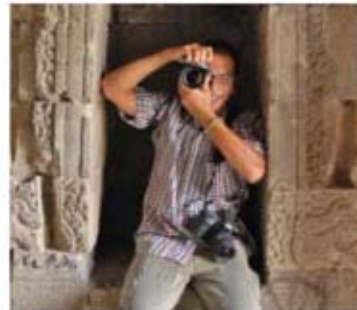
写真家ドディー・オベンク氏