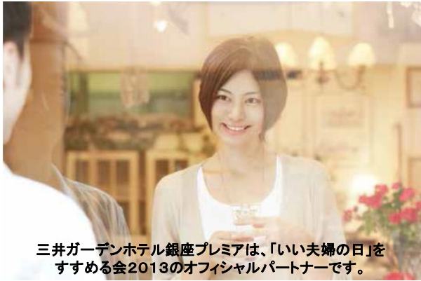
三井ガーデンホテル銀座プレミアは、「いい夫婦の日」をすすめる会2013のオフィシャルパートナーです。

三井ガーデンホテル銀座プレミアは、いい夫婦の日(11月22日)にちなみ、夫婦の絆を確かめ合う、とおきの宿泊プランをご用意。また三井ガーデンホテルズ開業30周年を記念して、抽選で豪華賞品をプレゼントいたします。銀座唯一のタワー型デザインホテルから眺める大人なシチュエーションと贅を尽くしたサービスを、是非ご夫婦でご堪能ください。