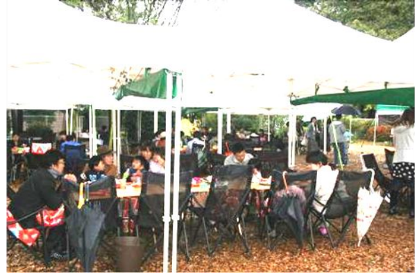
《両自治会合同懇親会の様子》