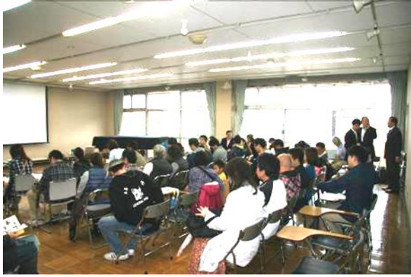
《自治会設立総会の様子》