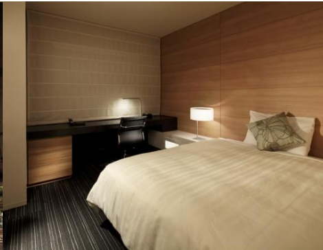
スーペリアルーム