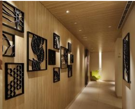
1階通路(アート作品)