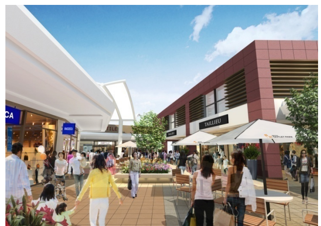
「三井アウトレットパーク 滋賀竜王」第2期（イメージ）