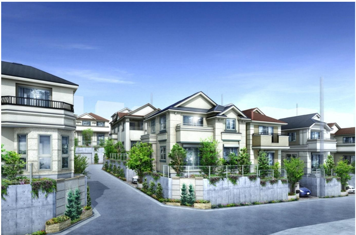
ファインコート大倉山マスターズヒル イメージパース