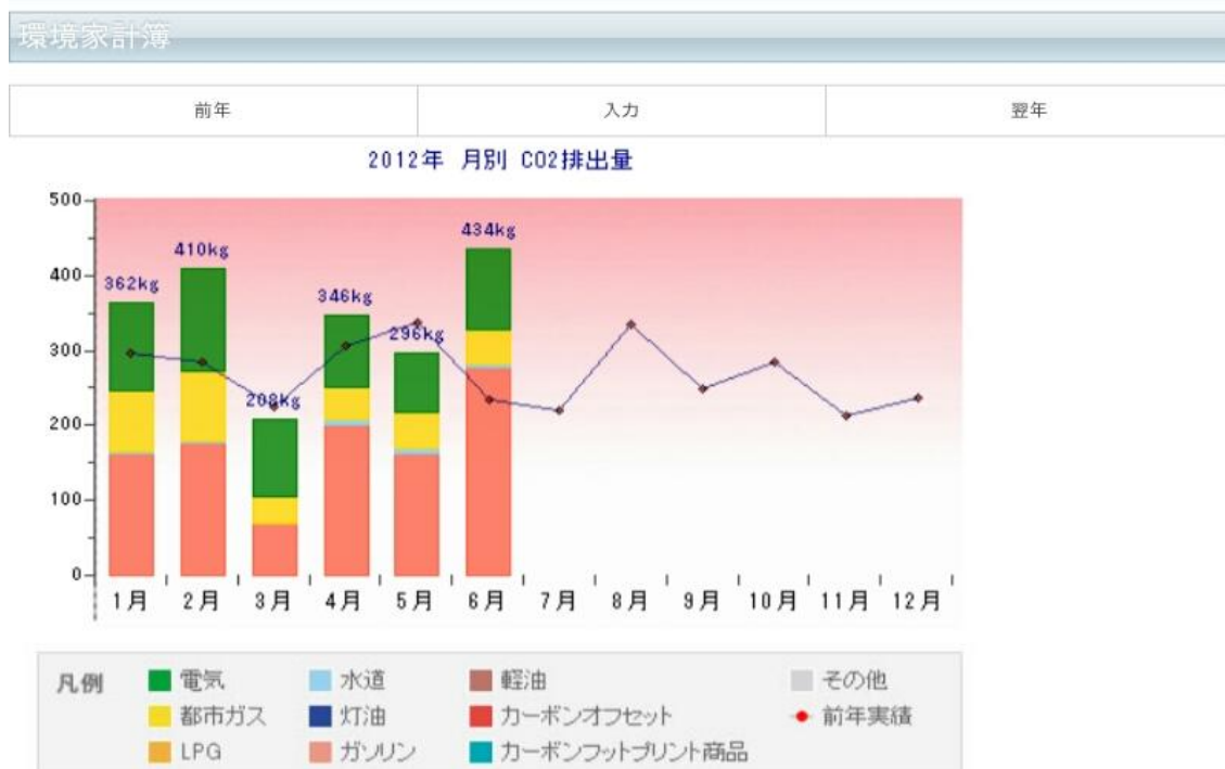
すまいのECOチャレンジ画面 イメージ