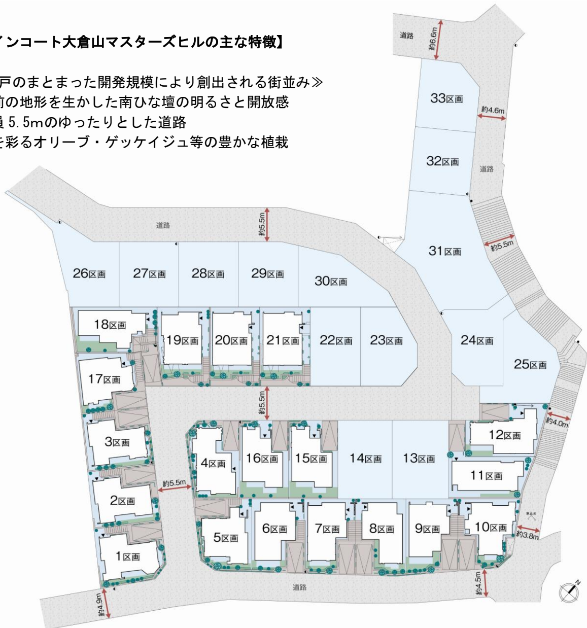
ファインコート大倉山マスターズヒル 配棟計画