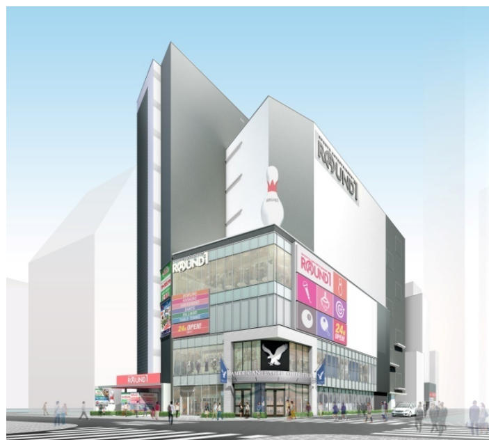
「池袋スクエア」イメージ