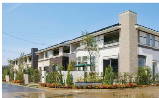
「ファインコートけいはんな公園都市」街並み写真 (三井不動産・三井不動産レジデンシャル)