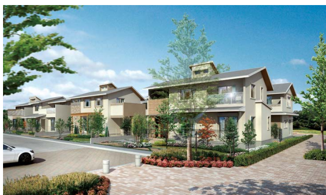
「ローズプレイスけいはんな公園都市」外観完成予想図 (京阪電気鉄道・京阪電鉄不動産)