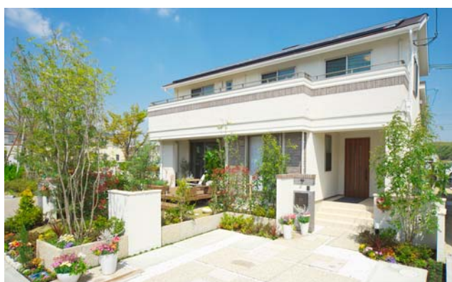
「ブラウドシーズンけいはんな公園都市」建物写真