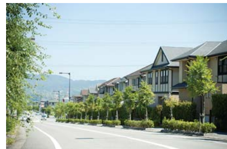
入居後10余年の「けいはんな公園都市」の街並み

■けいはんな公園都市は、平成11年の入居開始以来、すでに約1,350家族が住まう157万㎡の広大な街。その新街区として誕生する5社の街づくり「MiraiPa!」は、環境にやさしい緑豊かな街づくりはもとより、暑熱環境の緩和、長寿命機器の採用、居住者の環境活動及び環境教育の支援など、5社が一丸となって街づくりにおけるハード&ソフト両面からCO2削減に取り組んでいます。