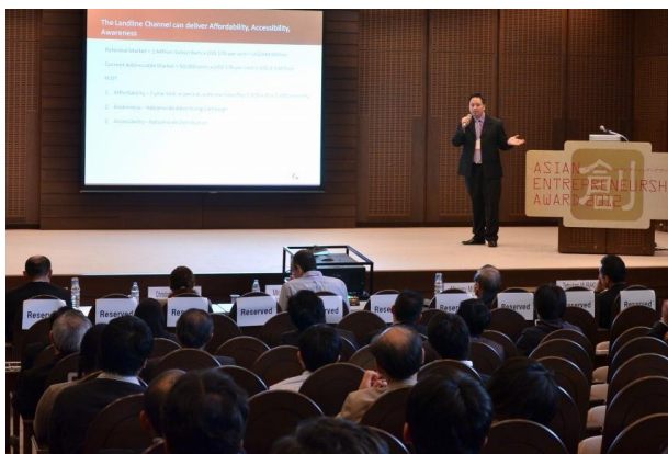
昨年度のファイナル風景。プレゼンテーションや質疑応答はすべて英語で行われる。

会期中はコンテストのほかにも、アントレプレナーシップ（起業家精神）の社会的意義やベンチャー企業支援のあり方に関する講演会、昨年度受賞者スピーチなどの多彩なプログラムを行います。また今年はより多くの方の来場を促進するため、一般聴講を無料としました。アジア最高峰の起業家と出会い、最先端の技術やビジネスモデルに学び、投資や事業連携を探る機会として、投資家や事業家、起業を志す学生など幅広い方々の一般聴講参加を見込んでいます。