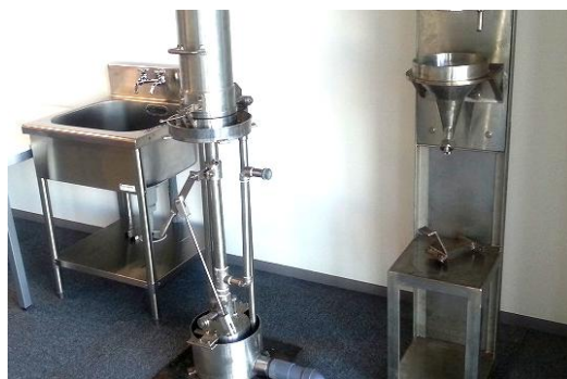
東葛テクノプラザ内に設置したリサイクルシステムのデモ機器