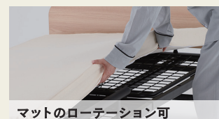
マットのローテーション可