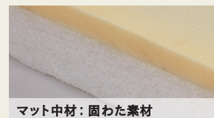
マット中材：固わた素材

マット表地にはニュアンスのあるアイボリーの織り生地を採用しました。別売で専用のボックスカバー（グレー、ライトグレー、アイボリーの3色）を用意しています。