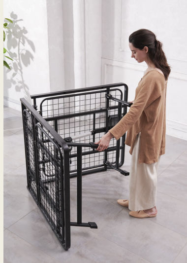
組み立て設置カンタン

長さ2mのベッドフレームを2分割。小さく折り畳んだ状態で納品されますので、搬入経路を選ばず様々な居住空間への設置が可能です。模様替えや引っ越し、収納にも便利です。また、組み立ては広げてヘッドボードとグリップを差し込むだけと簡単。立ち上がりがラクになり、布団の滑り落ちも防ぐグリップは設置場所や使用用途に応じて取り付け位置が選べる仕様になっています。