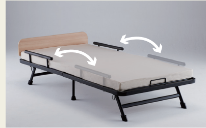
取り付け位置が選べるグリップ