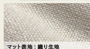
マット表地：織り生地