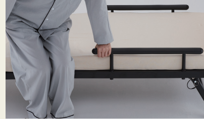
立ち上がりや布団の滑り止めの補助に