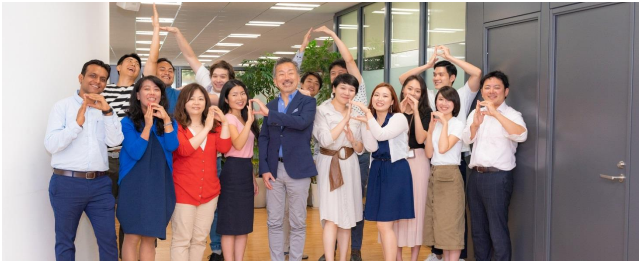
ポーターズ社内にて（ポーターズのPを表しています）

海外展開先：中国、タイ、シンガポール、フィリピン、マレーシア、ベトナム、インドネシア、台湾、メキシコ、インド