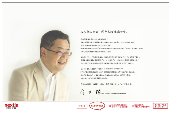
▲特設サイトトップページ

お客さまの声は同サイトにて2011年7月25日(月)より募集し、特設サイト内の「みんなの声の広場」へ定期的に公開いたします。