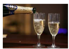
無料シャンパンボトル