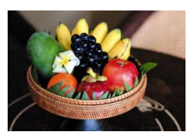
無料フルーツバスケット