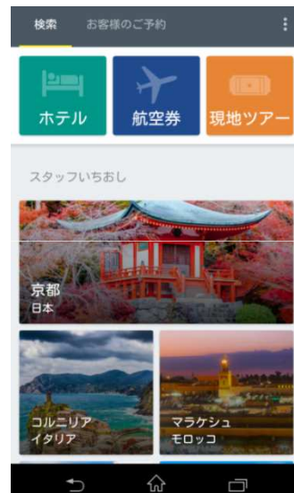
モバイルアプリのトップページ