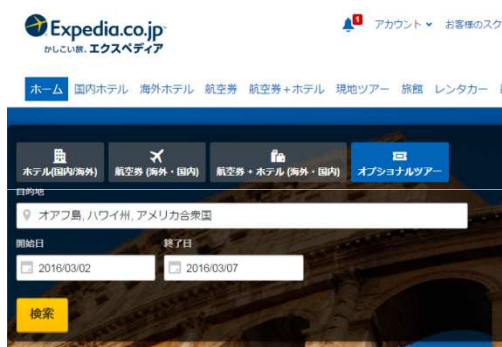
パソコンのトップページ

「現地オプションツアー」の検索はこちらから⇒ https://www.expedia.co.jp/Activities