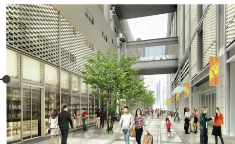
▲日本橋ガレリア(昭和通り方面から)