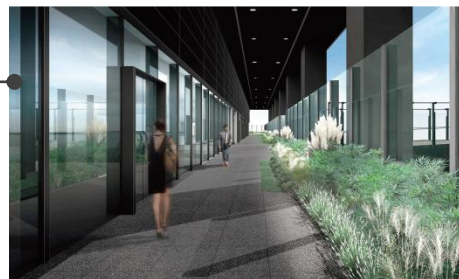
▲新館7F日本橋グリーンテラス(仮称)