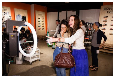
撮影した画像をその場でSNSにアップできるフォトブースで大いに盛り上がる参加者たち。