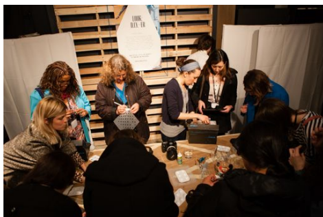
「オリジナル ユニバーサル」にクリスタルをつけたリペイントを施し、世界に一つだけのオリジナルなサンダルを作るD.I.Y-ERコーナー。