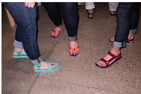
会場で見つけた参加者のスナップショット。「オリジナル ユニバーサル」と「オリジナル サンダル」にデニムをコーディネート。