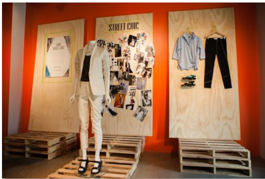
Free Spiritを表現したディスプレイ①