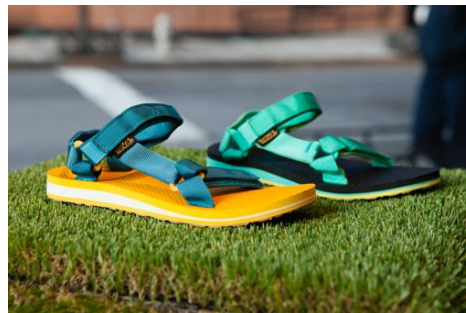
「オリジナル ユニバーサル」。日本では4月下旬より発売予定。