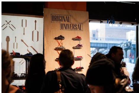
2014年春夏の新作「The Originals Collection」を展示したパーティ会場。

The Originals Collection Launch Party @ STORY