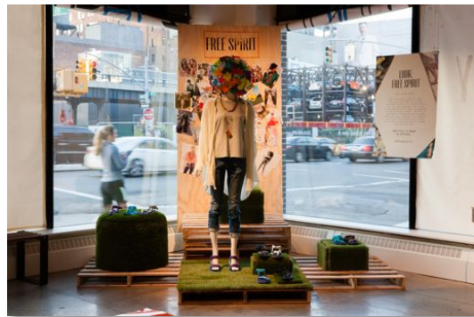
Free Spiritを表現したディスプレイ②

2014年4月2日(水) ニューヨーク — 太陽の輝くビーチ、夏休みの計画…。長い冬が終わり、ついにサンダルシーズンの到来です。Tevaはブランド生誕30周年を記念して、アドベンチャー・スピリットをテーマに、ブランドの象徴である オリジナルス コレクション をこの春から全世界で展開開始します。