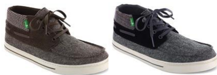
SCHOONER DEAN Men's ¥8,500 (+tax) BRN/CHRC