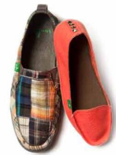
NO-LEDGE SIDEWALK SURFERS