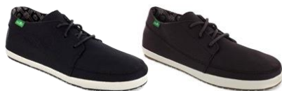
CASSIUS Men's ¥8,500(+tax) BLK/DKB