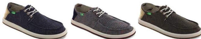
DREWBY DROPOUT Men's ¥7,800(+tax) NAVY/BRN/CHRC

■“No Ledge”：“縁なし”ソール。スリムなフォルムに生まれ変わり、細めボトムと合わせやすく進化したコレクション。フットベッドは軽量でクッション性のあるEVA素材で、抗菌加工済み。