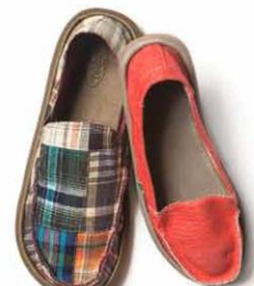
従来の“縁あり”サイドウォークサーファーズ CLASSIC SIDEWALK SURFERS