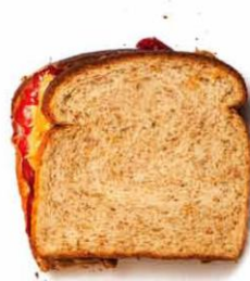
従来の“耳あり”サンドウィッチ CLASSIC SANDWICHES

これにより、“Ledge (縁あり)” と“No Ledge(縁なし)”, お好みのスタイルが楽しめるようになりました。