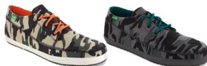
CASSIUS CAMO Men's ¥7,800 (+tax) OLIVE CAMO/GREY CAMO