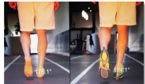
蹴り出す前(左:裸足、右:TevaSphere)