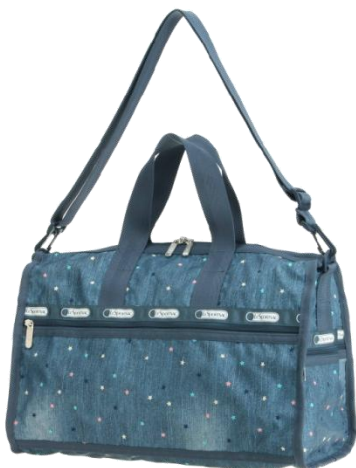
7184 Medium Weekender ¥22,200+税