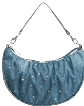
8058 Small Veronica Hobo ¥9,800+税