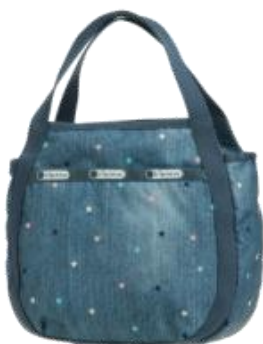
8055 Jenni ¥16,600+税