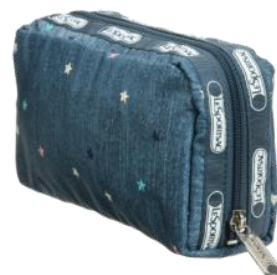
6511 Rectangular Cosmetic ¥4,600+税