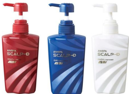
スカルプD オイリー・ドライ肌用シャンプー、 マッサージパック 各 ¥3,612