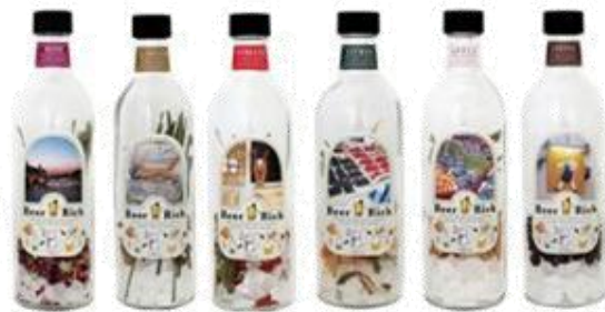
市販のビールで割ればオリジナルビールが 作れます。ピアリッチ 各 ¥850