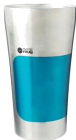
ステンレス二層のタンブラーで飲みごろ 温度をキープ！タンブラー ¥1,800