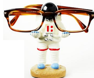
アストロノーツ メガネ スタンド ¥1789