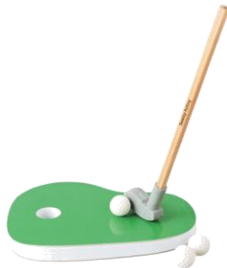
ゴルフモチーフのペン・メモセット ¥1,180