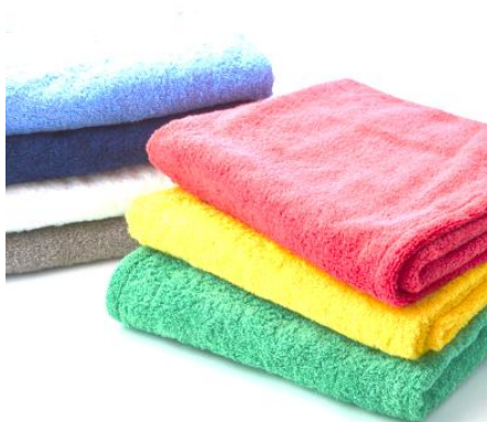
バスタオル 63×130cm ¥5,500(税抜)