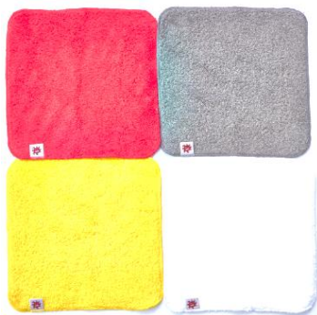
チーフタオル 22×22 cm ¥800(税抜)

毎日使う身近なタオルこそ長く使って、いいタオルに出逢えたと思ってほしい。そんな思いを込めて、「新しいタオルのスタンダード」をお届けします。