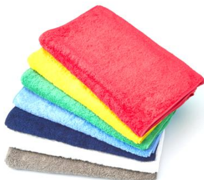
フェイスタオル 35×95cm ¥2,500(税抜)