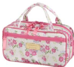
Pouch with beauler pocket ¥8,000