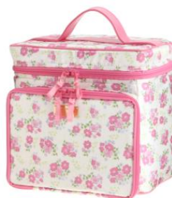
Vanity case ¥19,000