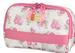
Angled pouch ¥6,000

「毎日使うものだから、本当にいいモノを。」そんな想いを込めて作られたコラボレーションアイテムのコスメポーチはin privateの春らしい可愛いデザインと、ARTISAN&ARTIST社の機能性・実用性を兼ね備えており品質にもこだわった日本製です。