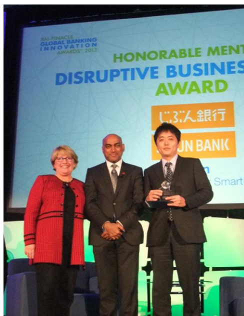
11月5日デンバーで行われた授賞式の様子

http://www.bai.org/globalinnovations/Libraries/2013-Press-Releases/2013_Global_Banking_Innovation_Awards-WinnersPressRelease.pdf