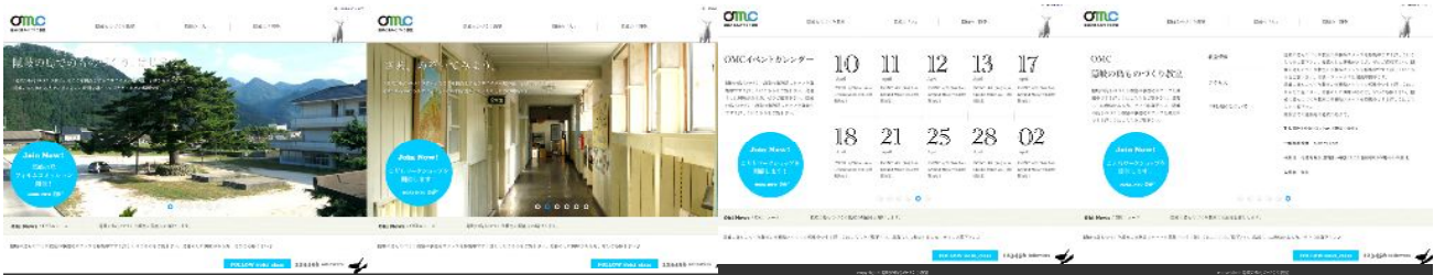
【テンプレート例(横)・レポート】

写真をフルスクリーンで大胆に見せることで、言葉だけでは伝わらない空気感まで伝えていくレポートサイト。イベントスケジュールなどに有効なカレンダーは、Google カレンダーをオリジナルデザインで美しく貼り付けることができます。