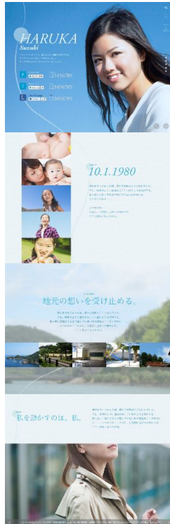
画像右【テンプレート例(縦)・プロフィール】

ダイナミックに登場感を煽るティザーサイト。短めのメッセージと写真を使い、起承転結をつけたストーリー設計でコンセプトをしっかりと伝えていきます。最後のスライドにはカウントダウンを設置して、本始動までの期間を盛り上げます。