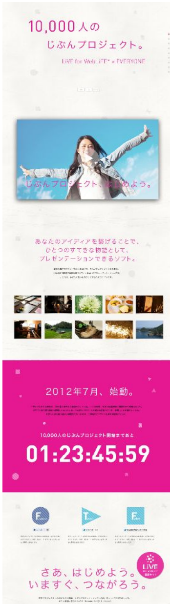
画像左【テンプレート例(縦)・ティザー】

ダイナミックに登場感を煽るティザーサイト。短めのメッセージと写真を使い、起承転結をつけたストーリー設計でコンセプトをしっかりと伝えていきます。最後のスライドにはカウントダウンを設置して、本始動までの期間を盛り上げます。