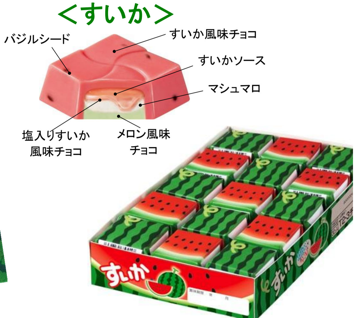
チロルチョコ〈すいか〉 23円(税抜き参考価格) 単品に塩袋は入っていません。