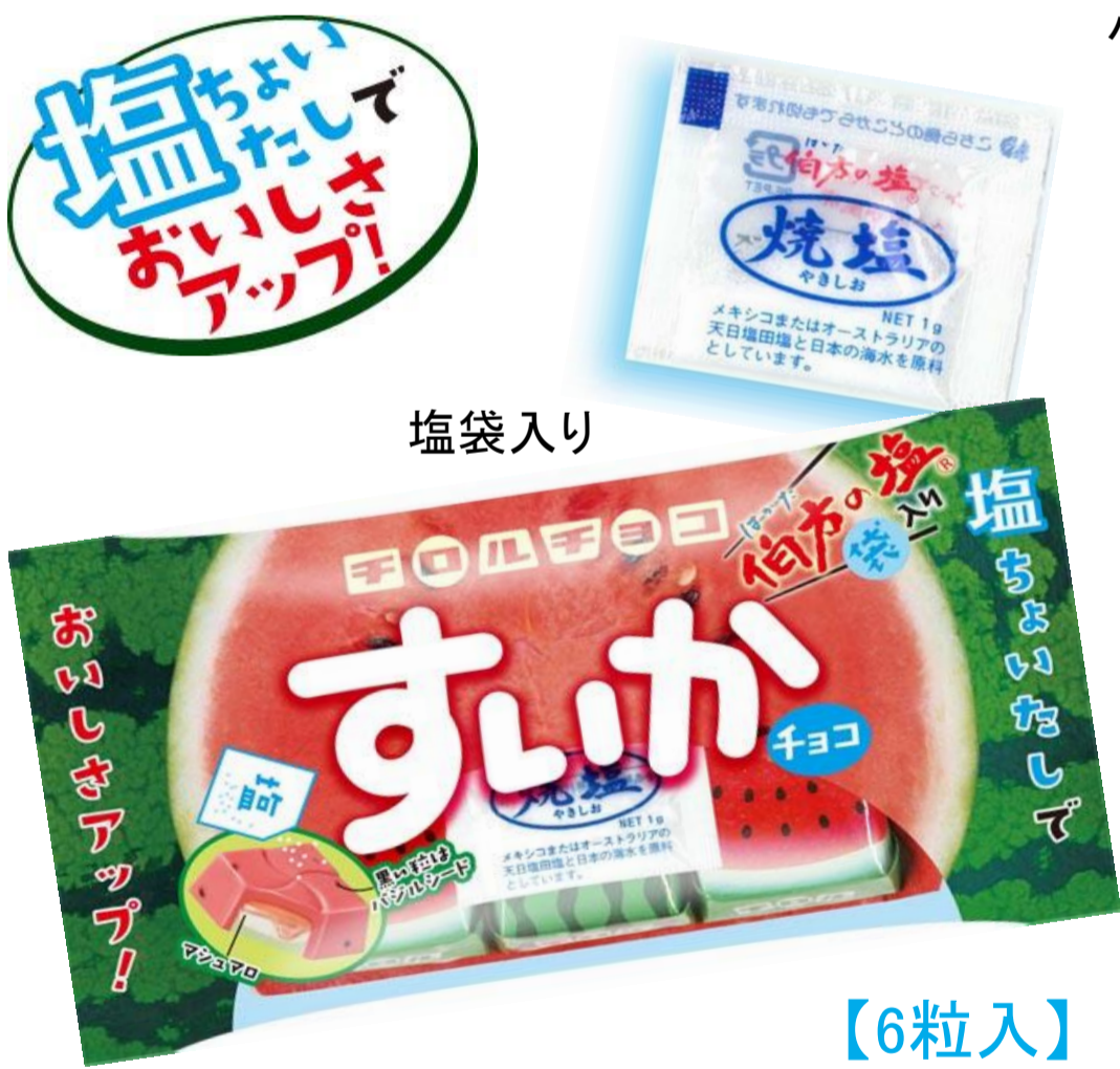
すいか〈袋〉 100円(税抜き参考価格)

チロルチョコ株式会社(東京都千代田区、代表取締役社長・松尾利彦)は、夏の風物詩「すいか」を再現したチロルチョコを発売いたします。塩袋入りで塩をかけて食べると、おいしさがよりアップ♪