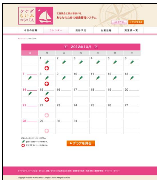
左:血圧・服薬・生活習慣記録の入力画面 右:カレンダー機能