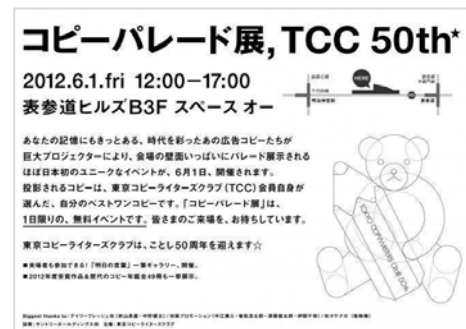
「コピーパレード展」メインビジュアル