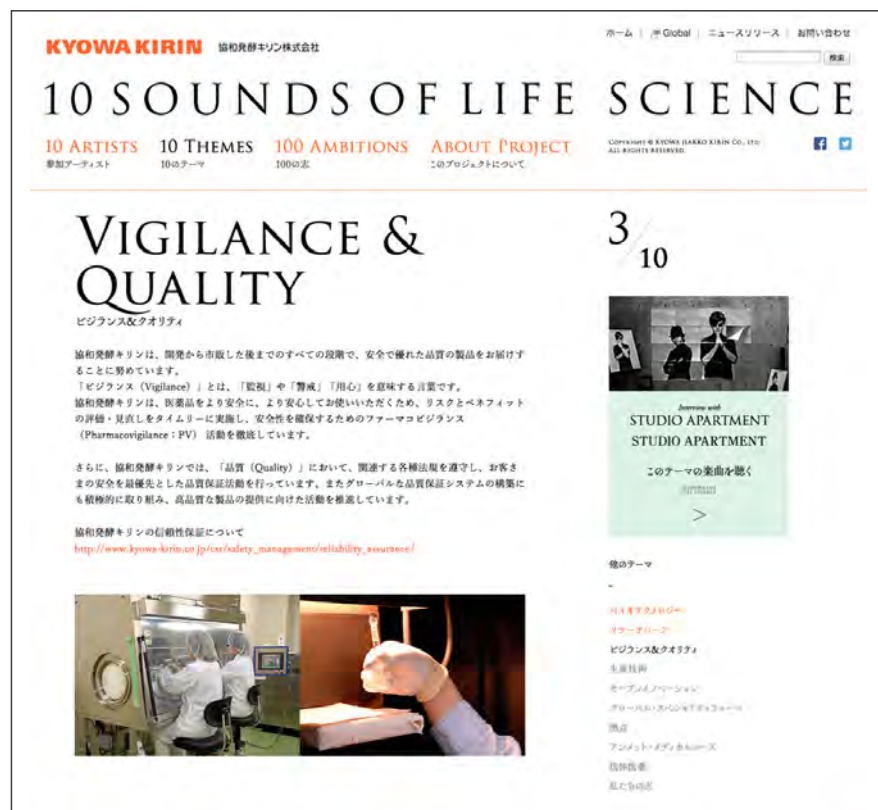
「10 THEMES」：各テーマの詳細をご紹介します。