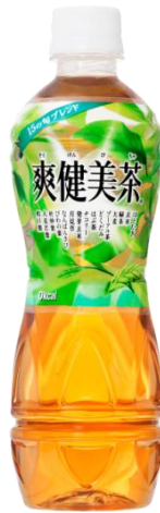
爽健美茶 500mlPET ボトル メーカー希望小売価格 147 円(税込)