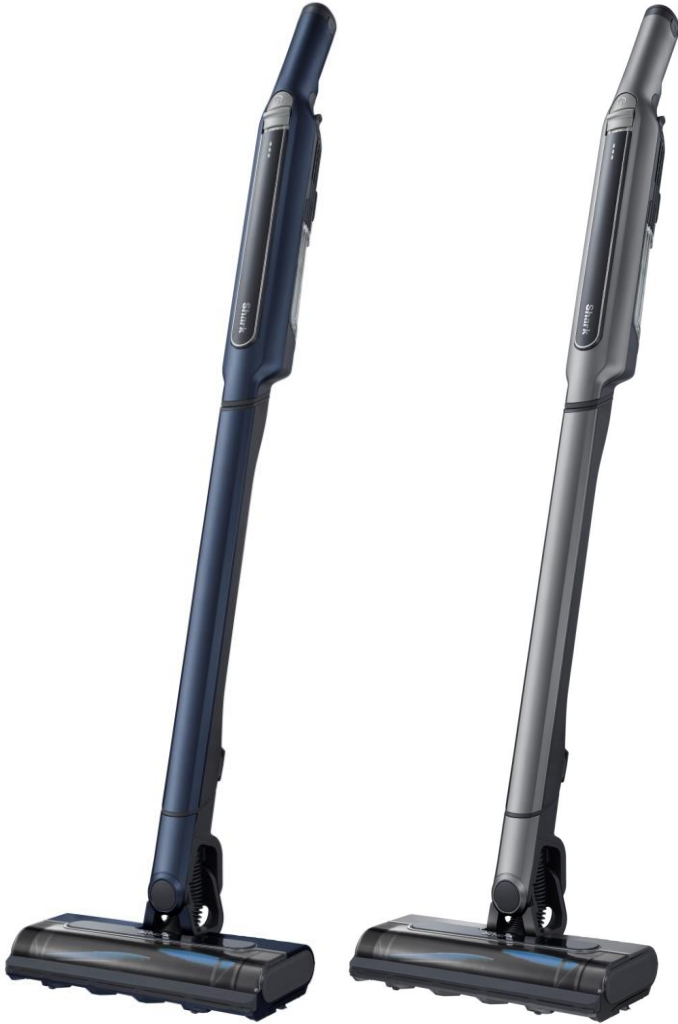
マルチフロア対応 EVOPOWER™ SYSTEM CS401シリーズ