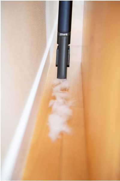
ブラシ付き隙間用ノズル