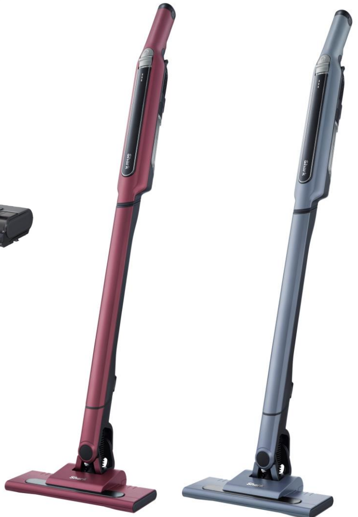
フローリング専用 EVOPOWER™ SYSTEM CS200シリーズ