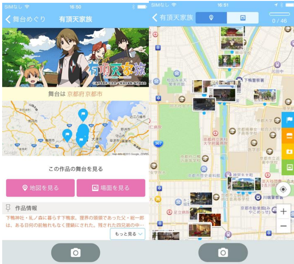
スマートフォンアプリ「舞台めぐり」画面