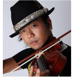
ヴァイオリニスト竜馬

・場所：1F 屋外イベントスペース「ソニースクエア」 ※雨天時は1F エントランスホール