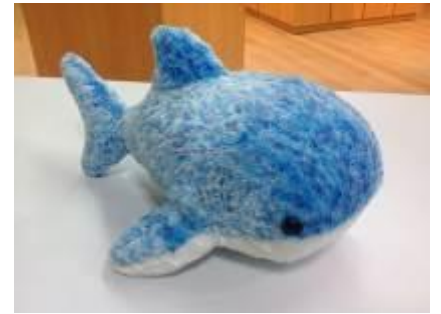
沖縄美ら海水族館限定 「ペタンコジンベエザメ」ぬいぐるみ