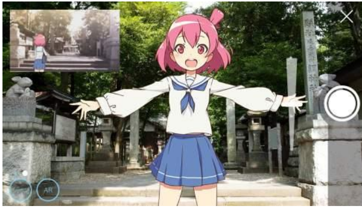
スマートフォンアプリ「舞台めぐり」ARキャラ写真画面