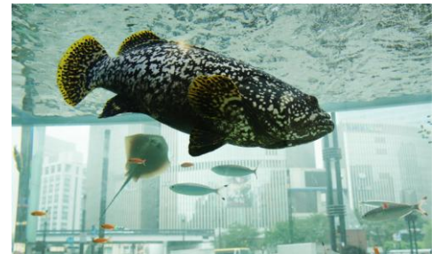
過去の屋外大水槽

水槽の裏側から銀座の街を覗いてみると、魚たちが街を泳ぎまわっているような風景が楽しめるので、自分でまとめた自由研究ノートに、撮影したとっておきの一枚を貼り付ければ注目度も抜群です！