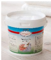
ドイツ生まれの衣料用漂白洗剤 「スーパーウォッシュパワー」 5.1万個超/日の史上最高記録。

11月1日には、開局15周年を迎え、この日に放送した特別番組では1日あたり約12億円（※）という売上高を記録しました。また、年間を通じて、強みである「商品力」「番組力」「オペレーション力」を高める努力を続けた結果、1日で5万個以上という販売個数を達成した商品が複数あり（下記写真参照）、ショップチャンネルの過去最高記録を塗り替えました。今後も、お客様の声により一層、耳を傾けながら、より良い商品、番組、サービスの実現に努めてまいります。