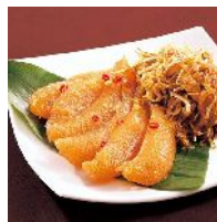
ベストセラー「黄金松前漬」 2010年までの記録を更新。