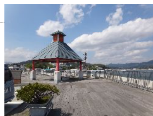
生中継会場：気仙沼魚市場

ショップチャンネルでは、特別番組『日本を見つけよう』シリーズを2008年から開始しました。日本全国の“地域”にフォーカスし、当地ならではの名産品を紹介する人気番組です。時には現地中継を交え、商品だけでなくその土地ならではの伝統芸能や文化を紹介し、日本各地の魅力をたっぷり伝える、ショップチャンネルならではの特別企画です。