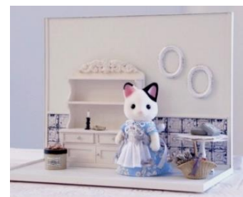
▲ワークショップ作品イメージ

URL： http://shop.odakyu-dept.co.jp/shop/