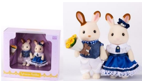
▲キュートカップルセット 2,970円 展覧会限定人形※お一人様5点まで

URL： http://shop.odakyu-dept.co.jp/shop/