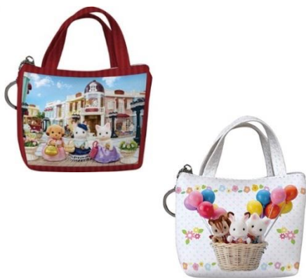
▲キャンディバッグ(ミルクキャンディ10粒入) 各880円 展覧会限定品