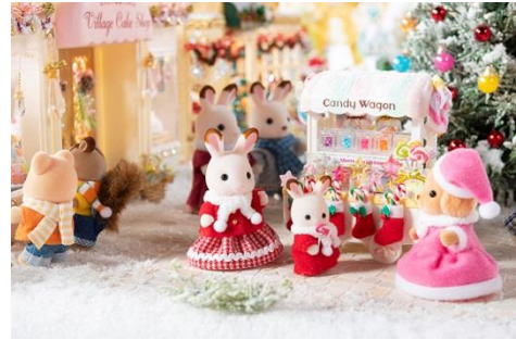
▲日本ドールハウス協会やドールハウス作家などのコラボレーション作品