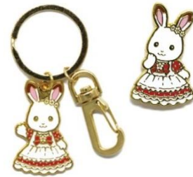
▲ (左) キーリング 770 円、 (右) ピンズ 550 円 展覧会限定品