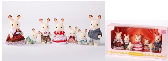
▲ショコラウサギファミリー 6,050円 展覧会限定人形※お一人様5点まで