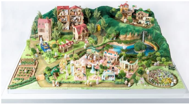
▲シルバニア村を再現した大型ジオラマ