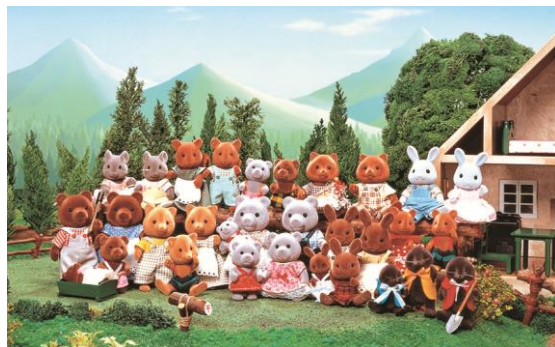
▲シルバニアファミリー集合写真（初代）1985 年