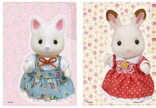
▲ダイカットクリアファイル 各 660 円 展覧会限定品