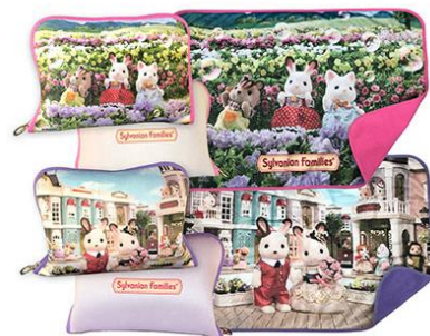
▲アートブランケット(ピンク・パープル) 各3,850円 展覧会限定品