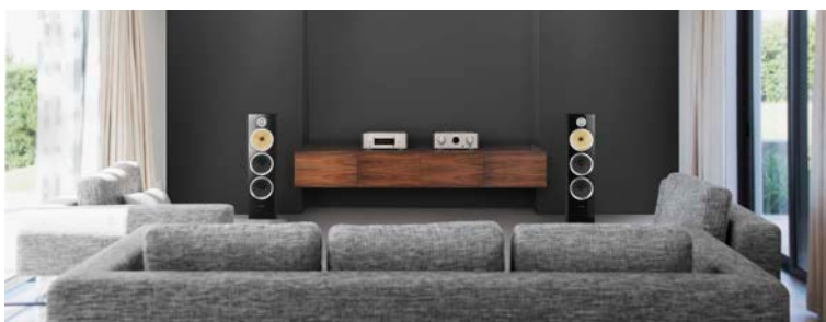
組み合わせ 設置イメージ — リビングルーム (HD-CD1 + HD-AMPI + B&W CM9S2)