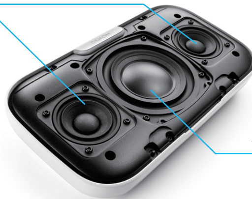
100mm パッシブラジエーター