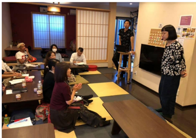
△大阪観光大学がこれまで開催した社会人向け講座の様子