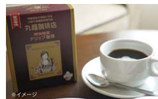
※イメージ ▶濃厚なコクと味わいのドリップ珈琲