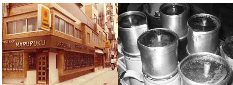
▶戦後間もない頃の千日前本店。80年間守り続けた独自の焙煎技術と抽出器具 ▶語り継がれる創業当時の想いとこだわり