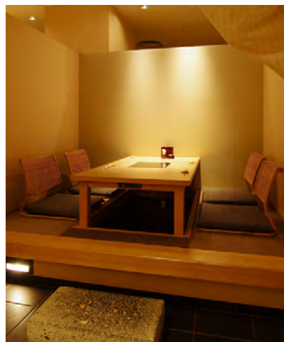
▲「四季彩 かっぽうバイキング」 料理人の技が光る、旬の食材を使った本格的なお料理の数々をご賞味ください。