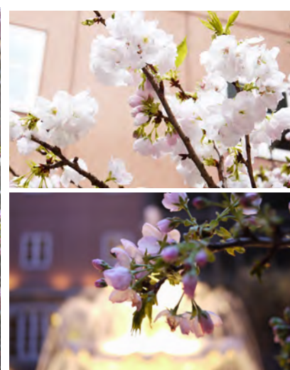
▲さくらと春の花が彩りを添えるパティオ(中庭)(昨年の様子)