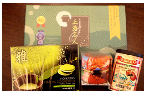
日本茶や抹茶を使用した商品