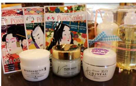
パックや保湿クリームなどの美容品