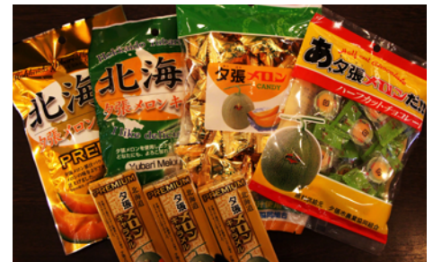
北海道の夕張メロンを使用した商品