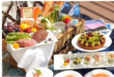
ピクニックランチバスケット