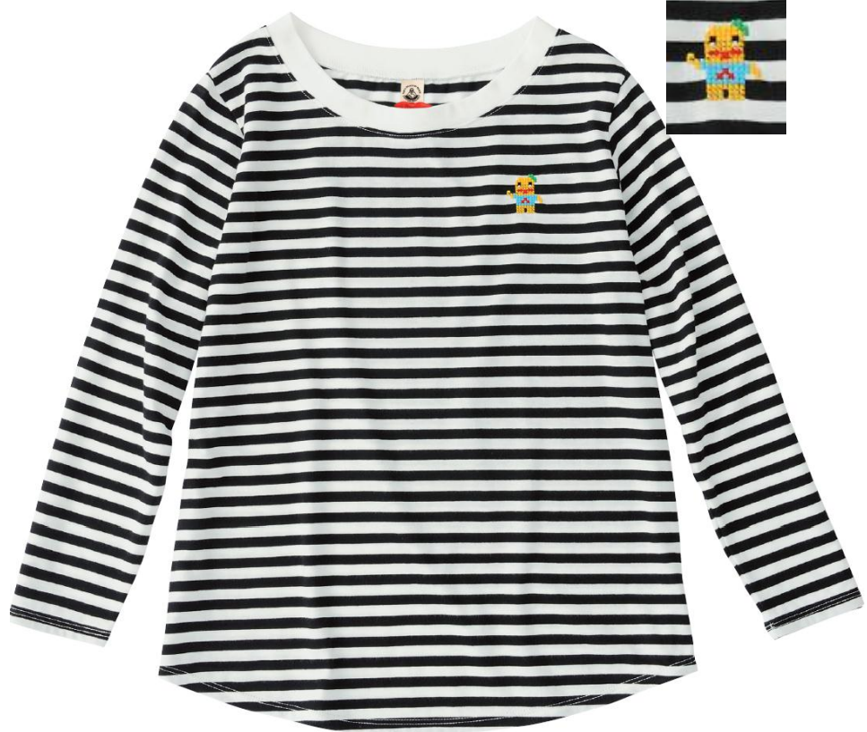
オーガニックコットン ふなっしーボーダーカットソー 5,500円+税（うち300円は基金） サイズS/M/L 1色のみ※レディース ※店舗限定ノベルティ付き ◎ふなっしー