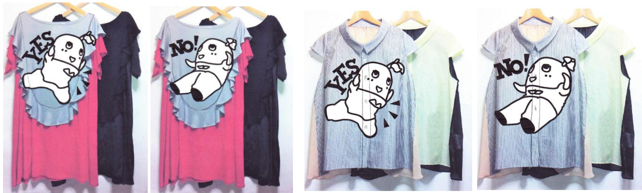
ふなっしーカットソーワンピース(仮) ※イメージ画像 ©ふなっしー