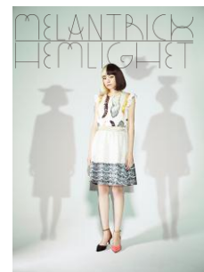
メランリックヘムラ