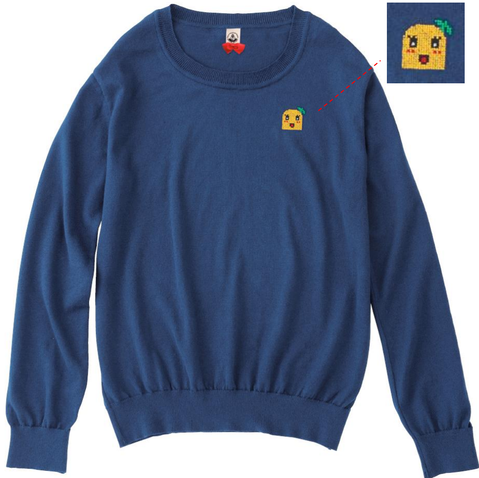
オーガニックコットン ふなっしーニット 6,500円+税（うち300円は基金） サイズS/M/L 1色のみ※レディース ※店舗限定ノベルティ付き ◎ふなっしー