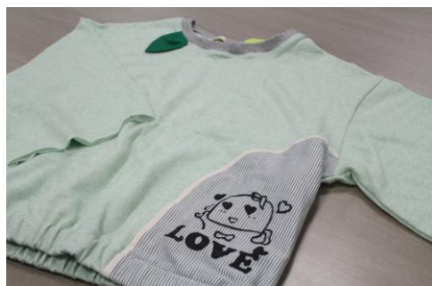
ふなっしーリメイクトップス(仮) ※イメージ画像 ©ふなっしー