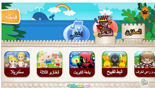
アラビア語版アプリ「童話」選択画面