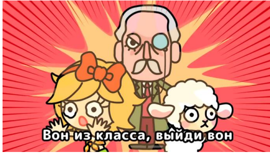
ロシア語版 童謡『メリーさんのひつじ』一場面