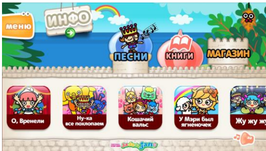
ロシア語版アプリ「童謡」選択画面

Android: https://play.google.com/store/apps/details?id=jp.co.forii.jajajajanru