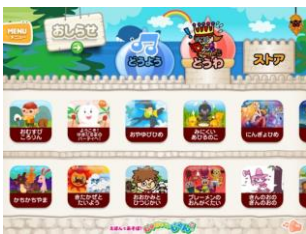
日本語版アプリ「童話」選択画面