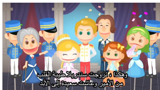
アラビア語版 童話「シンデレラ」一場面