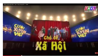
Television Network Vinh Long