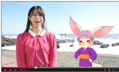
方言アフレコ体験教室で使用した動画

当社は当事業の一環として、被災地の中から青森県八戸市、岩手県釜石市、宮城県仙台市、福島県福島市、茨城県東茨城郡大洗町の5カ所の方言を取りあげ、被災地域の方言に親しむための動画を制作し、平成25年度に当社が制作した文化庁Webページ「方言アフレコ体験教室(* ii)」として公開いたしました。また、前述の各地域で小学生から高校生までを対象に「方言アフレコ体験ワークショップ」を開催。プロの声優の指導のもと、制作した動画に合わせて方言を用いたアフレコ体験を実施し、子供たちに楽しく方言に親しむ機会を提供いたしました。