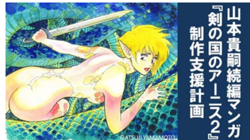
山本貴嗣続編マンガ 『剣の国のアーニス2』 制作支援計画

『剣の国のアーニス』は、臓器が飛び出しながらも剣をふるう半不死の女剣士アーニス・イスカリスの旅と戦いを描いたシリアスなダーク・ファンタジー作品です。1989年から1990年まで『コミックノイズィ』(大日本絵画)で連載され、単行本全1巻が発売されました。その後、同人誌で1~7話まで発売されたものの、最終章は未発表の状態であったため、今回のプロジェクトでは、山本氏が第8話(全60ページ)を執筆し、続編として1~8話をまとめた1冊の電子書籍『剣の国のアーニス2』として完成させることを目的としています。