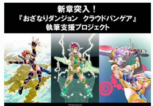
新章突入! 『おざなりダンジョン クラウドパンゲア』 執筆支援プロジェクト

『おざなりダンジョン クラウドパンゲア』PDFデータ、『おざなりダンジョン クラウドパンゲア』冊子、こやま基夫による直筆サイン入りミニ色紙、『おざなりダンジョン クラウドパンゲア』完成記念オフ会参加権、ROM『キャラクター秘密ブック』、ROM『3Dおもちゃ箱』etc.